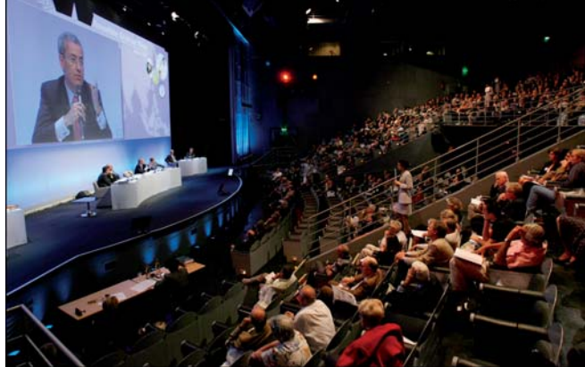
Vue d'ensemble de l'Assemblée